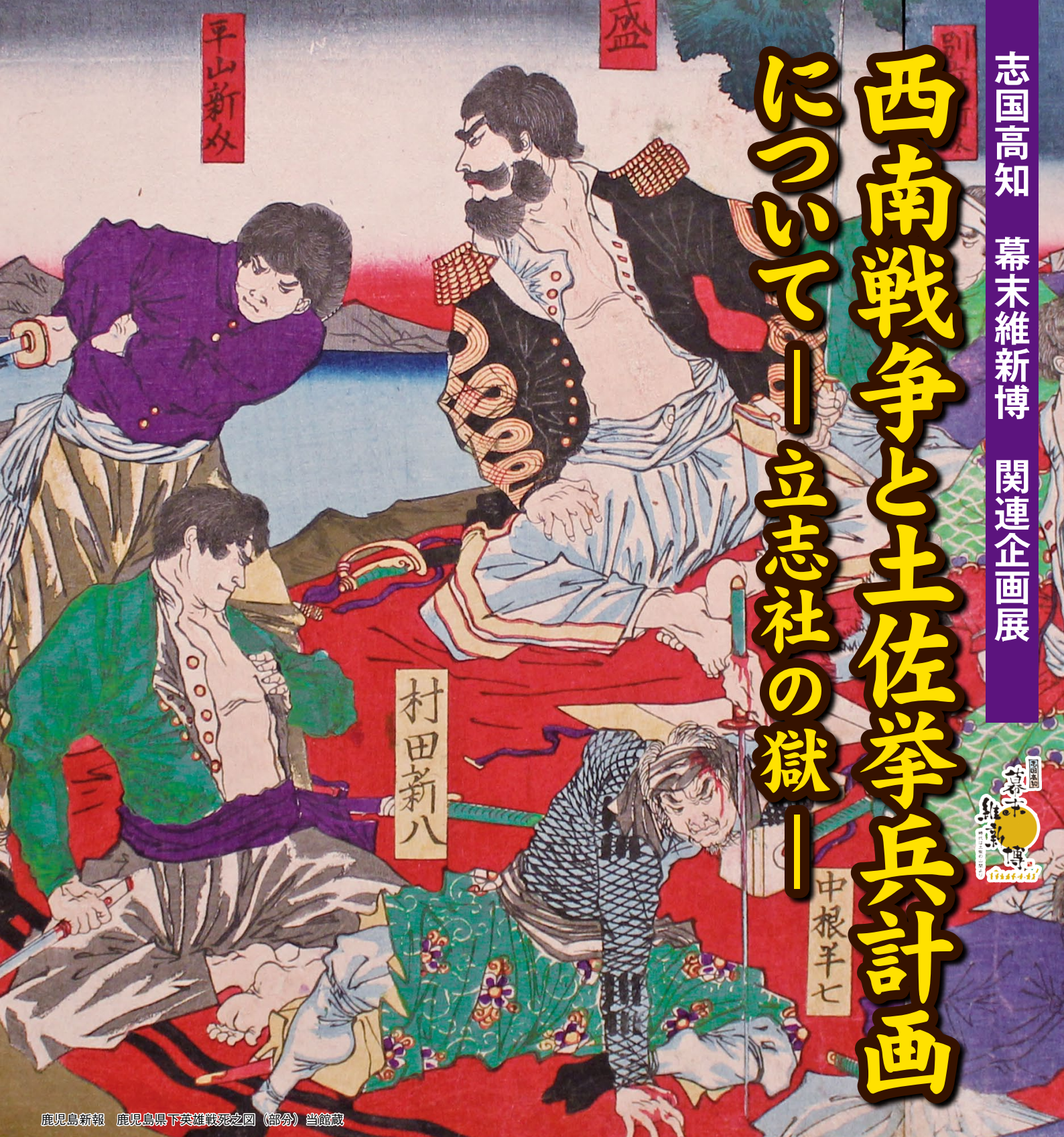
鹿児島新聞 鹿児島県下英雄戦死之図 (部分) 当館蔵